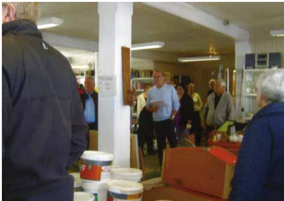
Donation fra Gelsted Genbrug 2012