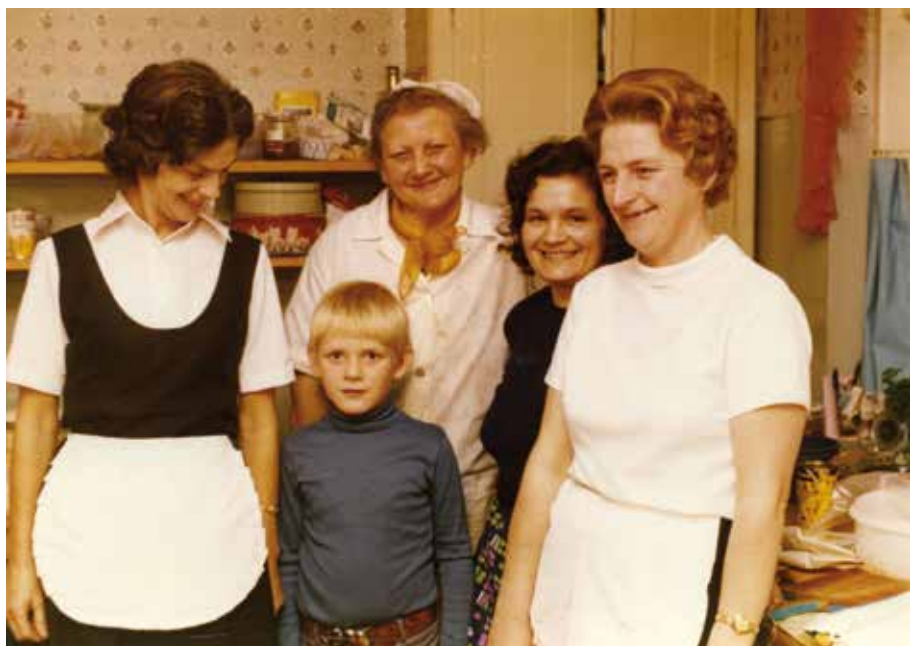
Køkkenhold til en fest