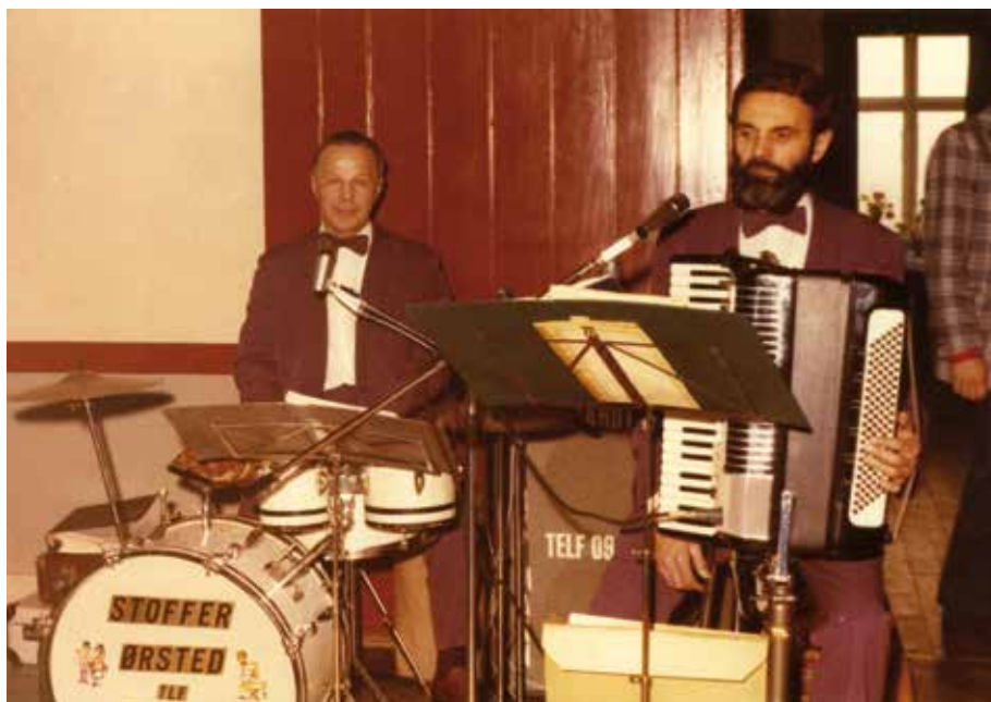
Musik til en familiefest