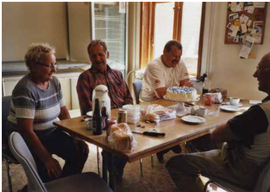
Kaffepause, arbejdsdag 2010