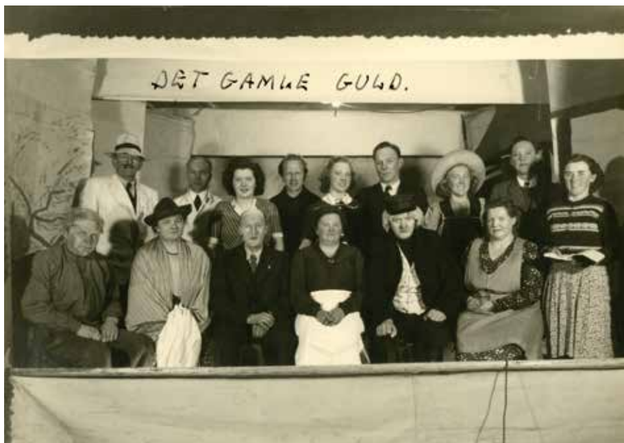
Det gamle guld. 1947