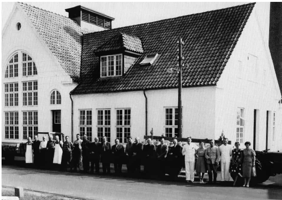
75 års jubilæum