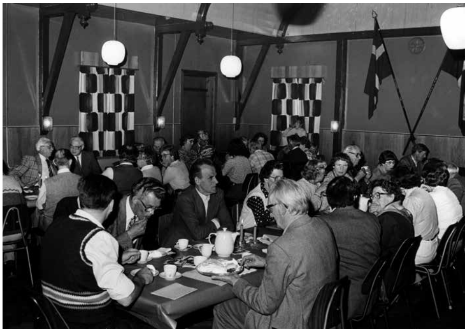
Ejby Kommunes LHA's årsmøde 1984