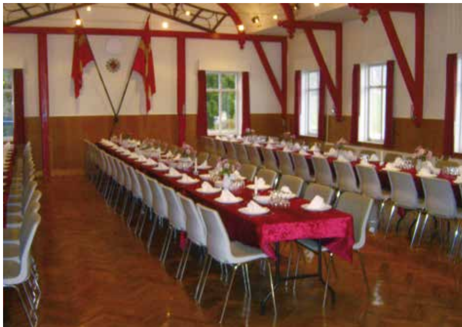
Mortens aften 2011