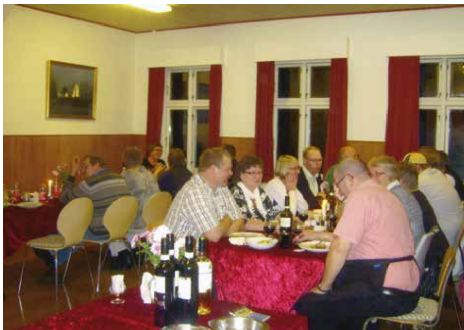
Mortens aften 2011