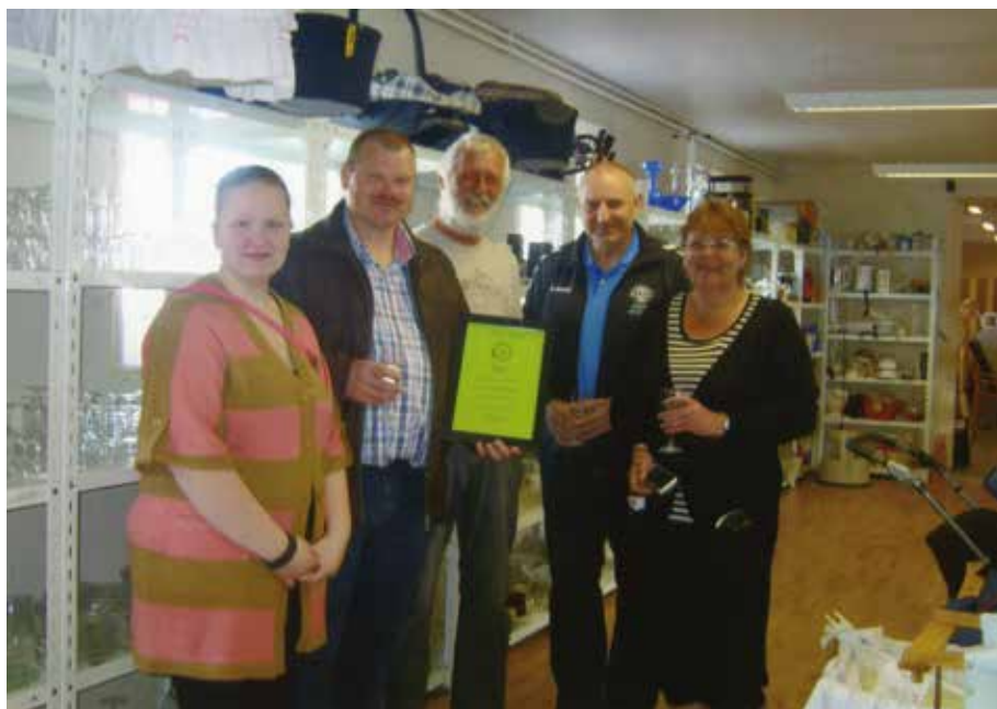
Donation fra Gelsted Genbrug 2012