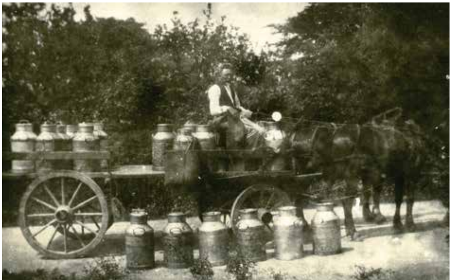
Mælkekørsel fra Mosegård