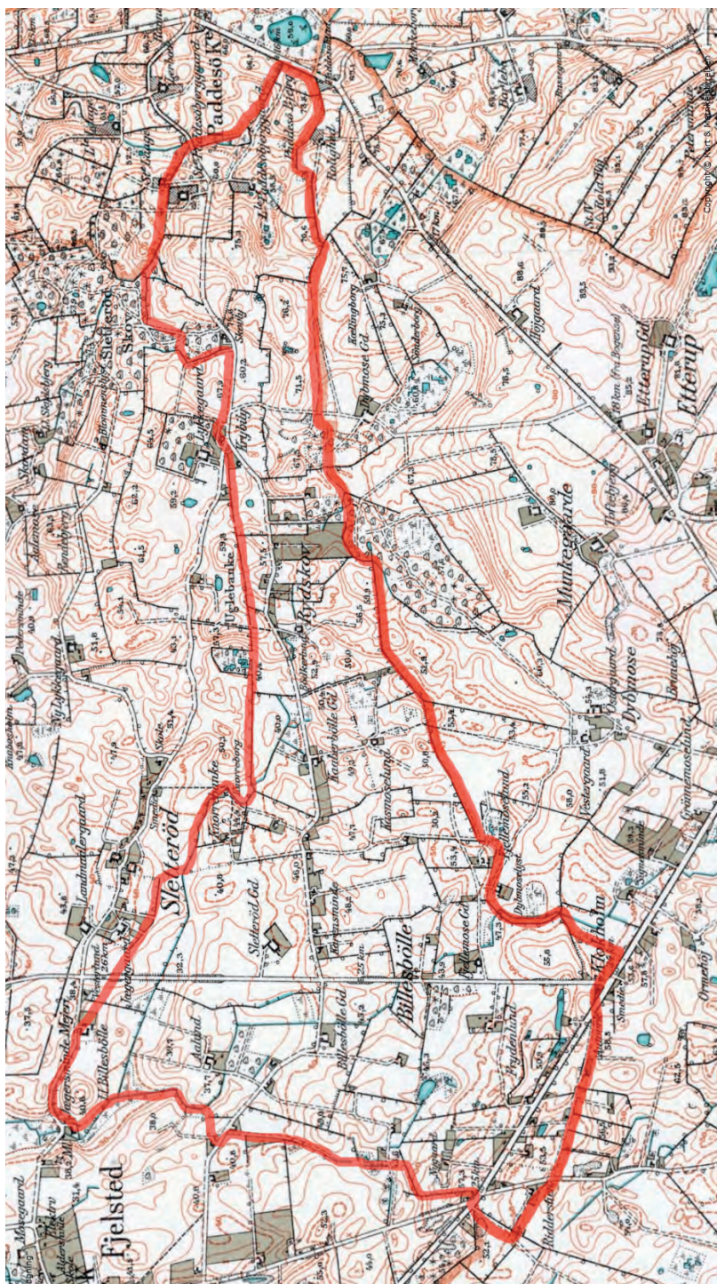
Målebordsplan fra 1945. Billesbølle ejerlags grænser er markeret med rødt. Kort og Matrikelstyrelsen.