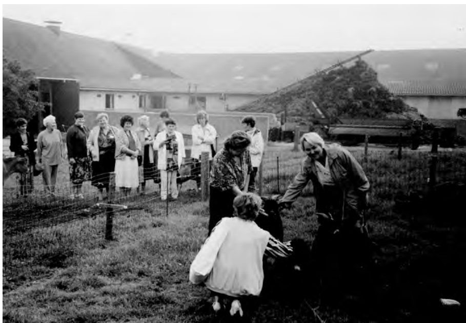
Gæster på besøgsbondegården Billeshøj, hvor gederne vises frem.