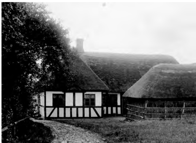
Der er ikke mange tidlige billeder af de oprindelige bygninger. Her er det pyntelige husmandssted Marienro, opført ca. 1830. Nedrevet 1920. I dag en del af Rydskovvej 8.