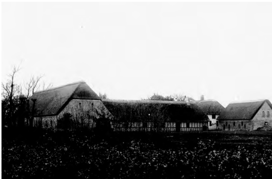
Billesbøllegården fotograferet fra syd omkring 1910.