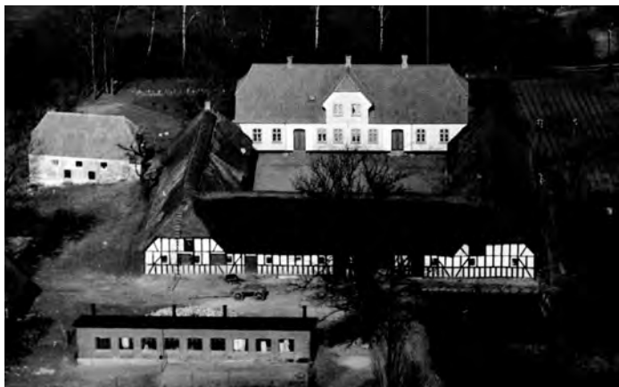
Store Padesøbjerg. Denne gård kan være områdets ældste kontinuerlige bebyggelse. Foto: Sylvest Jensen 1949. Det kongelige Bibliotek.

senere matrikel nr. 54, og Lars Hansen fra Dybmosegård i syd tog også et stykke – dog først gennem d’hr. Smith mv. Det er dog ikke muligt at følge alle køb/salg fra hånd til hånd i detaljer. Tinglysning var ikke en selvfølge, og ofte ser man kun salget, hvis køber optog lån med sikkerhed i ejendommen.