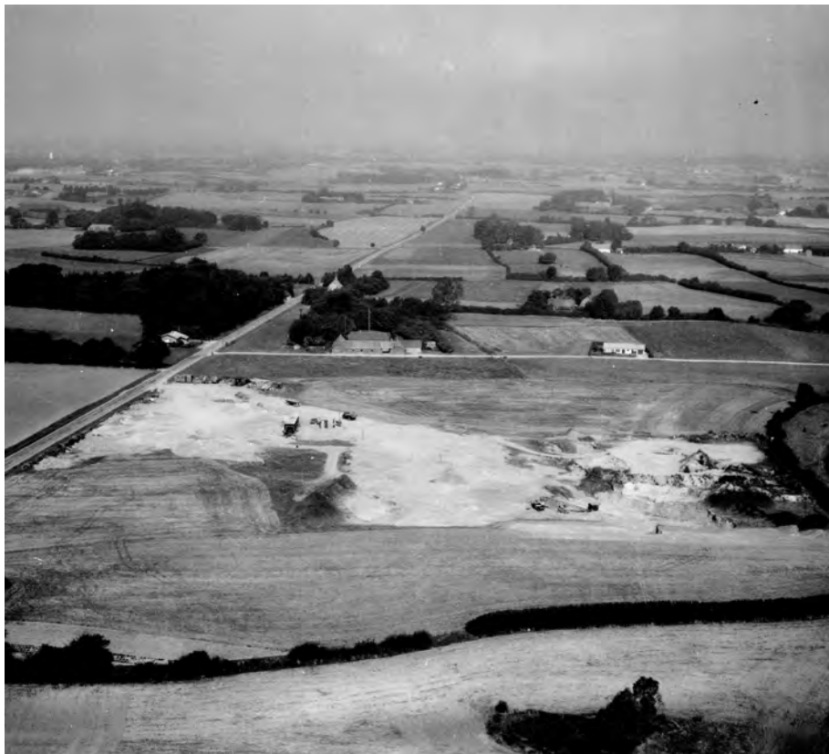
Der har været gravet grus i Billesbølleområdet "altid" og gør det stadig. Her ses grusgrave mellem Store Landevej og Fjellelosevej i 1961.

Man kan gennem folketællingerne følge udviklingen: I 1901 med 59 familier på området kaldes 10 brug for gårde, 16 husmænd, der levede af deres jord. Der er to vævere, en træskomand og to snedkere. Men også en vognmand, en brøndgraver, en handelsagent, købmand, slagter, skomager, drængraver, humlehandler, rebslager, vejmand, engmester, drejer, murer, hjulmand, tækkemand, en teglværksbestyrer og to, der lever af alderdoms-understøttelse. Udviklingen gik mod større specialisering, og ting, der engang var en del af dagligdagen i det enkelte hus, kunne nu være overladt til en specialist. I 1930 er der nogenlunde lige så mange familier – 60, men nu er der også en mekaniker, en cykelhandler, en forsikringsagent, en hattemager, en rokkemand og en fodermester. To unge arbejdede på Odense Stålskibsværft.