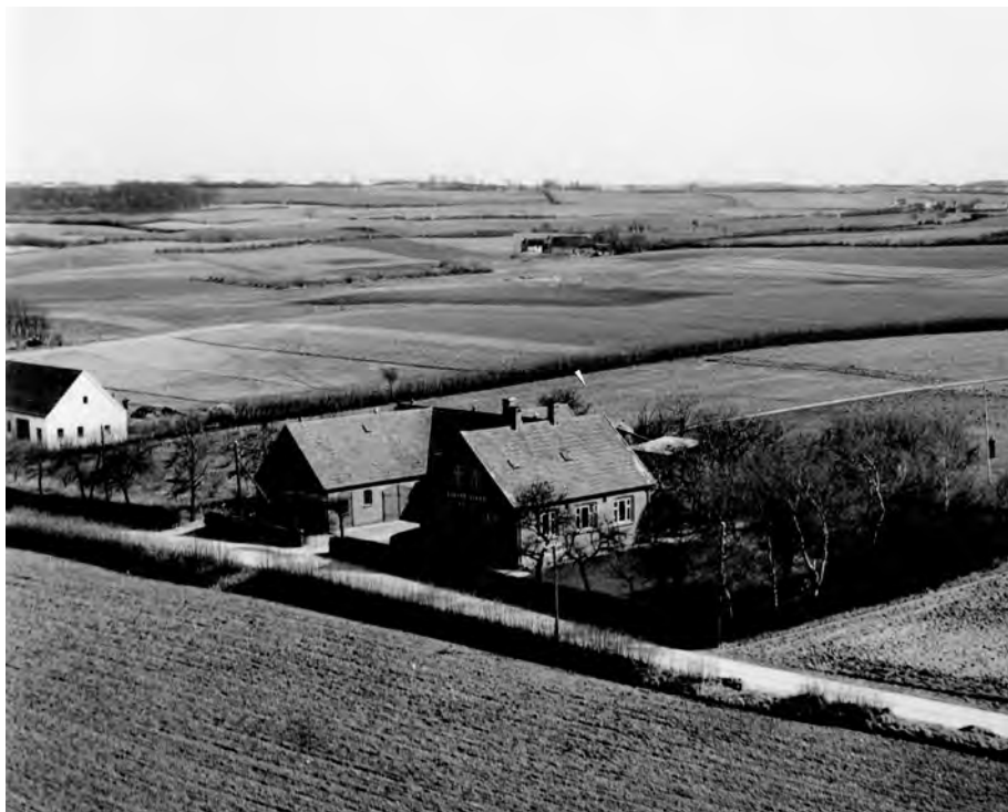
Karens Minde, Rydskovvej 3, set fra oven.