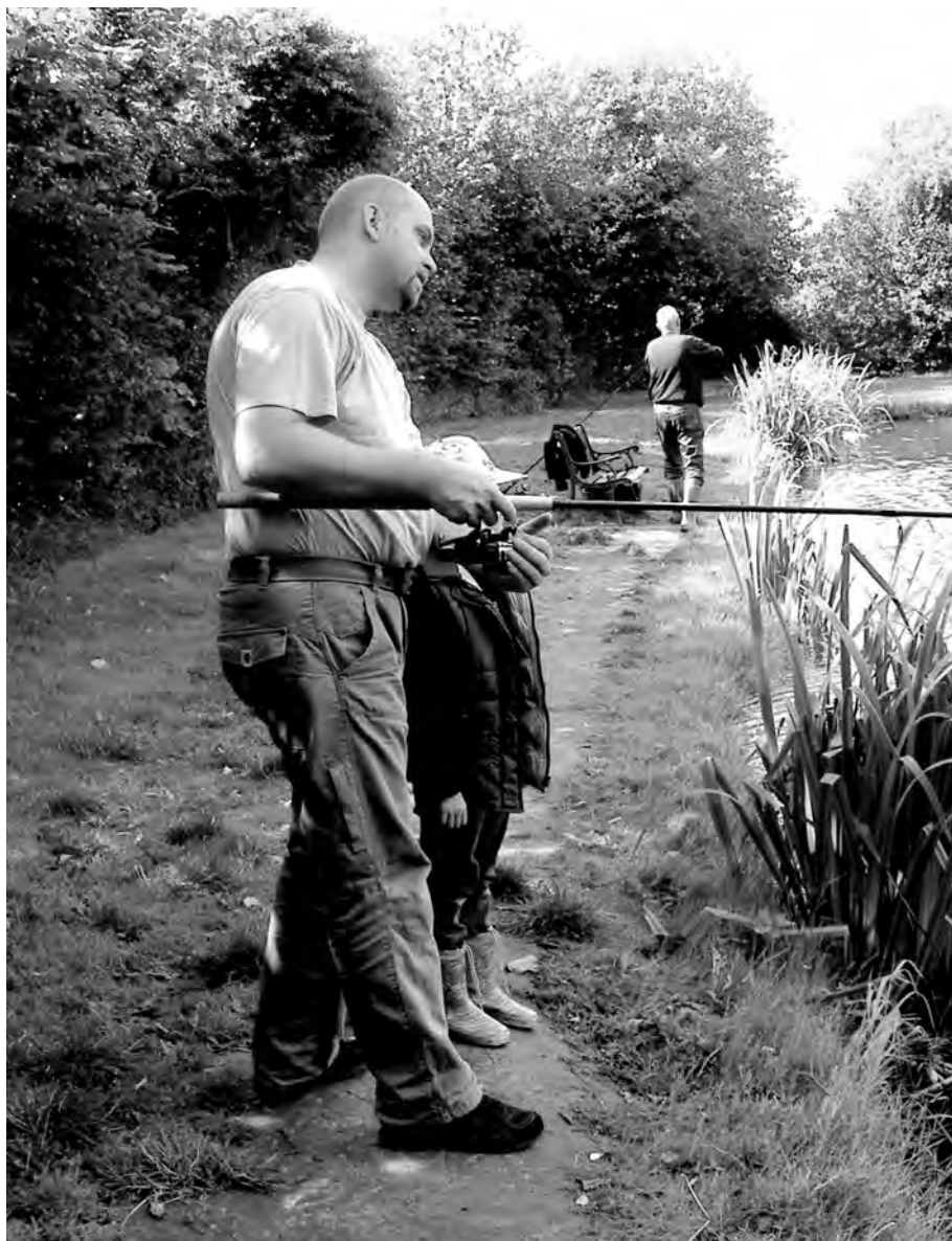
En god stund ved Børges fiskesø 2013.

I Billesbølle i dag er der endnu landbrug, men også institutioner, håndværkere, mindre virksomheder mv. Men stadig fremstår det som et naturskønt område med snoede veje, gamle og nyere huse, åben skov og udsyn. Uendelig fredeligt, trods nærhed til hovedvej og motorvej.