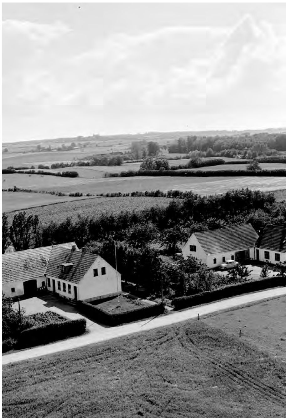
To statshusmandsbrug fra 1920erne: Rydskovvej 9 og 11, ca. 1950.