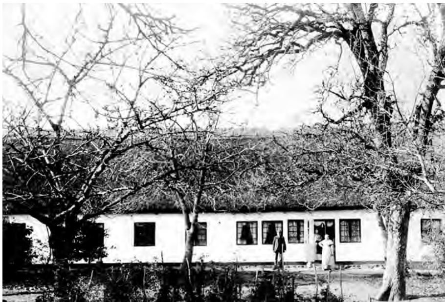
Billesbøllegårdens stuehus set fra haven 1899.