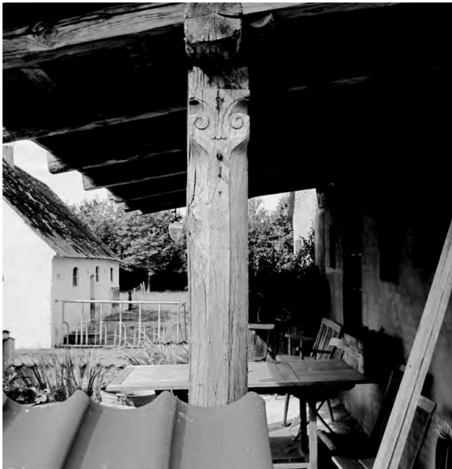
Den nuværende ejer har fundet forskellige ældre elementer i de stående bygninger. Således denne udskårne stolpe, der fint kunne passe i en herskabelig hestestald.

Da herregården forsvandt, forsvandt også områdets standspersoner og den skare af ofte udensogns tjenestefolk, der omgav dem. Såvel frue som husjomfru, kammerpige og kokkepige havde løbende båret børn til dåben, hvilket viser, at der var samkvem mellem herregård og egn. Også en anden ting forsvandt – kirkebogens regelmæssige indførsler om uægte børn, hvor mor eller far eller begge tjente på Billesbølle!