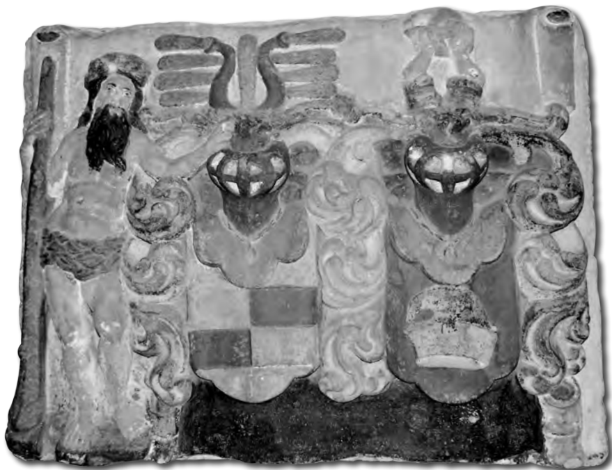
Sandstensrelief med våbenskjold for slægterne Bille og Kruse. Har oprindeligt siddet på herregården. Sad i mange år på gavlen på Billesbøllegård. Er nu på Middelfart Museum.