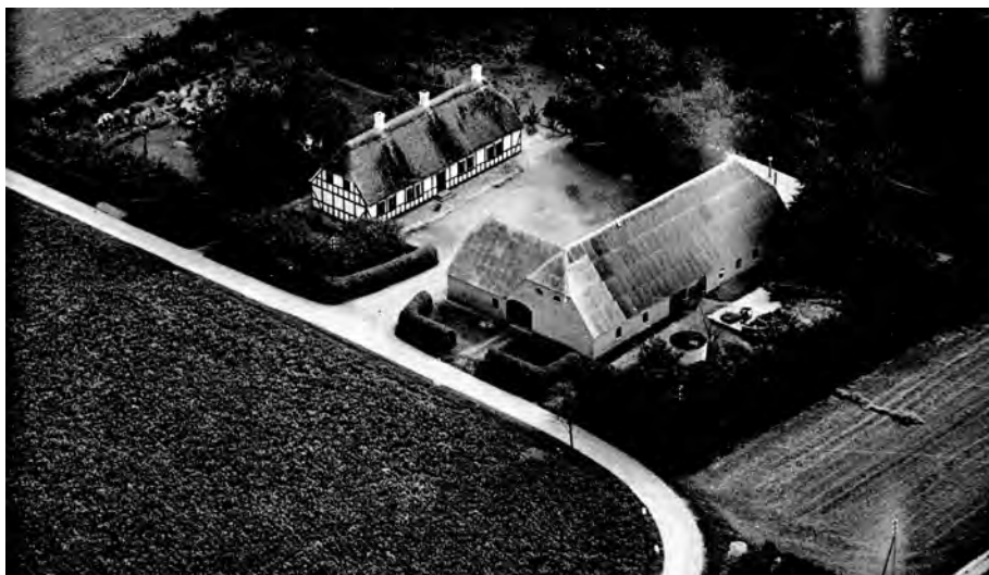
Luftfoto 1948. Den store staldlænge er blevet moderniseret og udvidet.