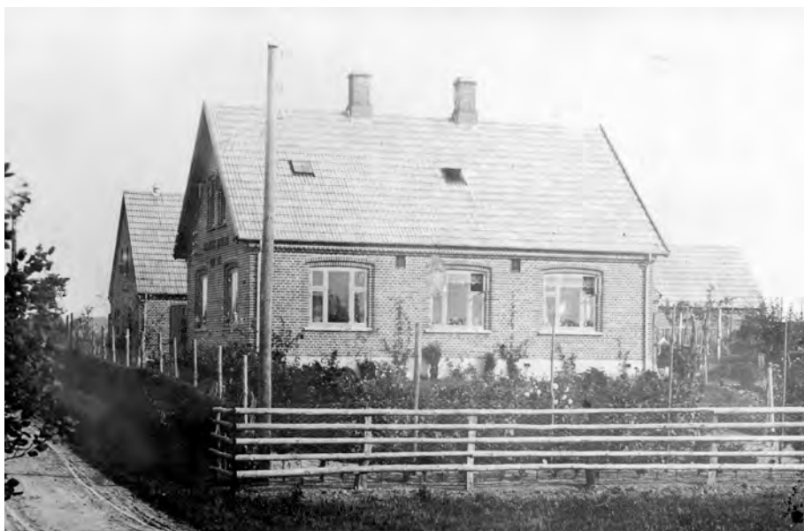
Karens Minde, bygget 1915. Her var plads til begge generationer og til sønnens skrædderi på 1. sal. Foto i privateje.