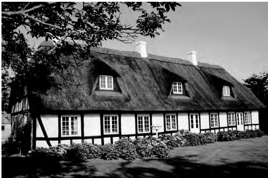
Billesbøllegården fotograferet i sommersonne 2014.