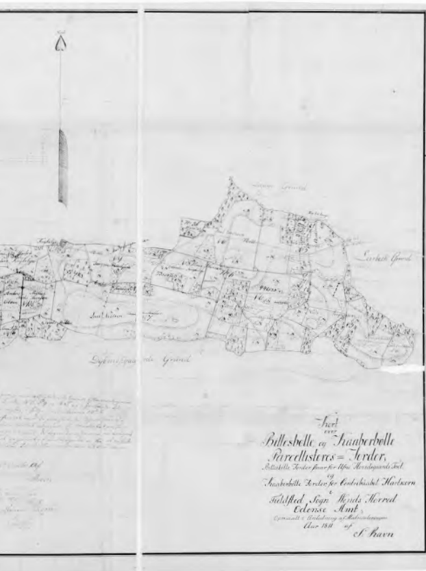
Det ældste kort over Billesbølle er et brugskort, der viser lodderne i 1811 med påførte ændringer, især nye ejere, frem til ca. 1840. Kort- og Matrikelstyrelsen.