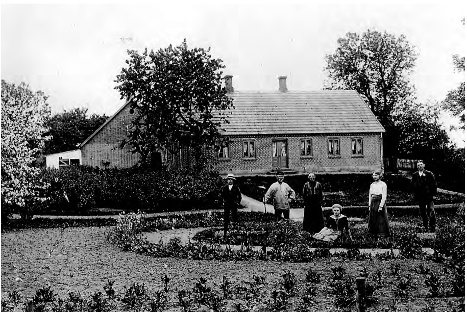
Bødkerlund, ca. 1920 med familien i haven. Slægten havde boet på gården siden 1820'erne. Bygningerne var opført 1907.