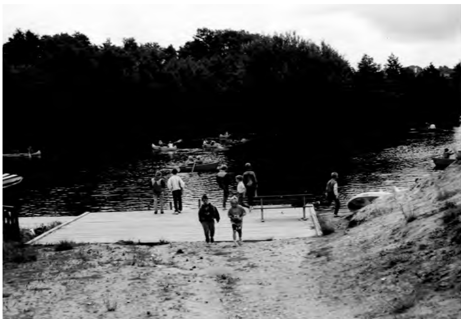
Fyns Sommerland 1992 med 4. klasse fra Ejby skole.