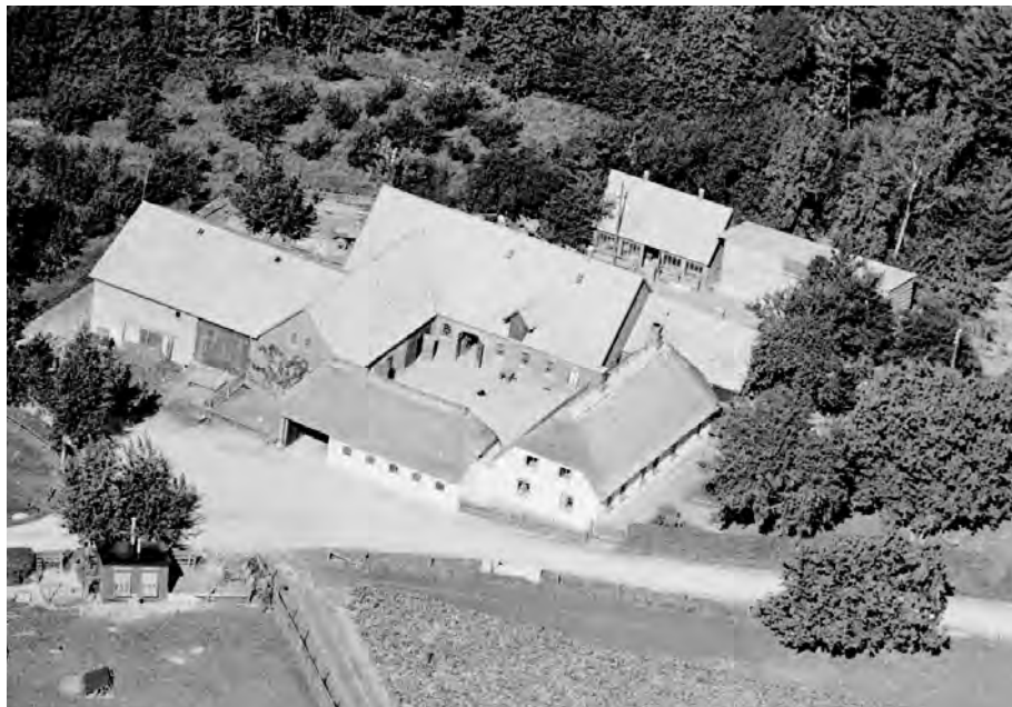
Krybily, Sletterødvej 36, opstod som et husmandssted omkring 1750, anlagt ved leddet til Sletterød, hvor vejen fra Billesbølle og Padesøbjerg mødtes. Her er gården fotograferet fra luften 1939.

Billesbølle nedlagde Kåberbøllegårdene og Padesøbjerg-gårdene i Landorphernes tid. Hvilket betyder, at Billesbølle området omkring 1750 stort set kun omfattede bygninger placeret omkring selve hovedgården – plus et enkelt sted på Padesøbjerg (Zacharias Hansen). Set i det lys har Store Padesøbjerg således den længste historie af alle på Billesbølleområdet. Men herefter ser vi her som på så mange andre herregårde et stigende antal huse placeret ude i området.