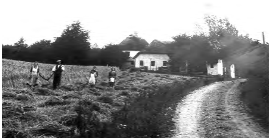
Høstbillede. Familien på Ny Krybily er i gang med høsten, ca. 1920. Et husmandssted var et familiebrug, hvor alle hænder var i sving.

Mange af husmandsstederne var for små, til at en familie kunne leve af dem. De fleste gik sikkert i dagleje, men det ses ikke i kilderne, hvis de sad i eget hus. Faktisk kan det store vejbyggeri i disse år havde hjulpet mange små familier. I 1801 var der endvidere flere, der kombinerede håndværk og landbrug. Der var en bødker og en sadelmager fra gammel tid, men herudover en væver og en skrædder. I oversigten fra 1816 er der to vævere, to tømrere og to snedkere. I 1845 er der 5 vævere, to skræddere og en tømrer, en brolægger, en træskomand og en smed. Deltidslandbrug er ingen ny opfindelse.