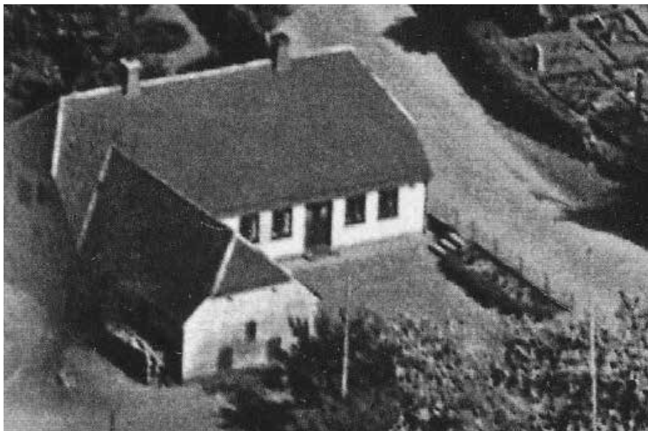
Det gule hus ved foden af kirkebakken i Harndrup (matr.nr. 50a) Vindebjergvej 6.