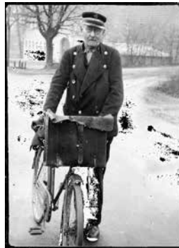
Sangen er skrevet af en beboer på postruten.