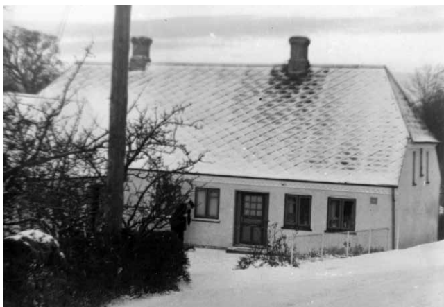
Matrikel nr. 50a