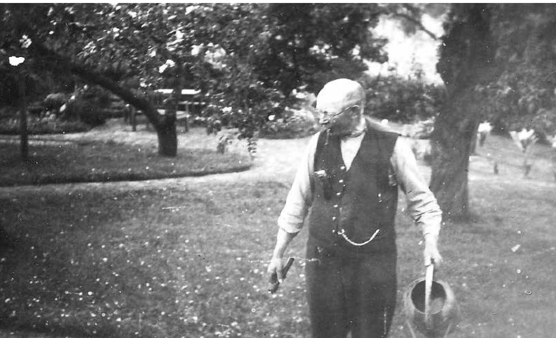
Bedstefar hjemme i haven.