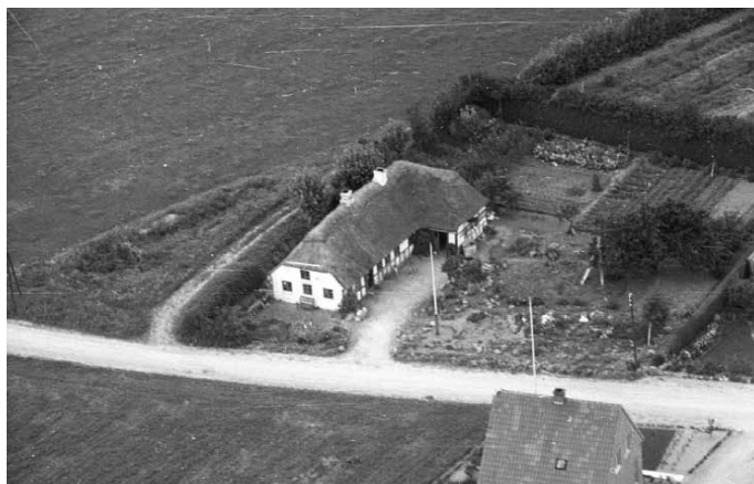
Foto fra perioden 1948 - 1952 Det er matr.nr. 58 d, der i dag har adressen Juelsmindevej 4.