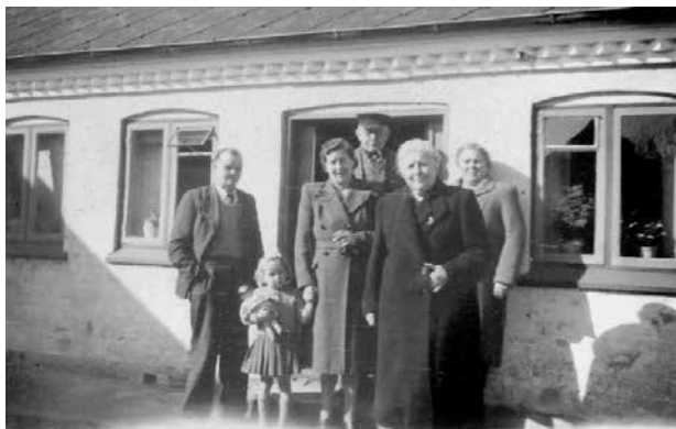
Familie på besøg. Bedstemor forrest og bedstefar bagerst. Jeg står med min mor i hånden. Foto fra ca. 1949.

afholdt hos landpost Nielsen, og takket være bedstemor kunne deltagerne sætte sig til bords ved et veldækket kaffebord hver gang. Somme tider har hun ganske sikkert lavet brun lagkage eller kiksekage til gæsterne.