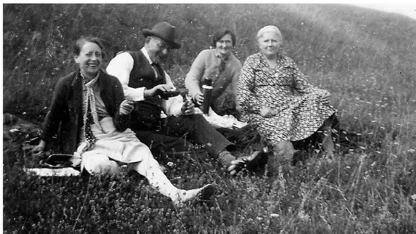
På udflugt med postvenner.