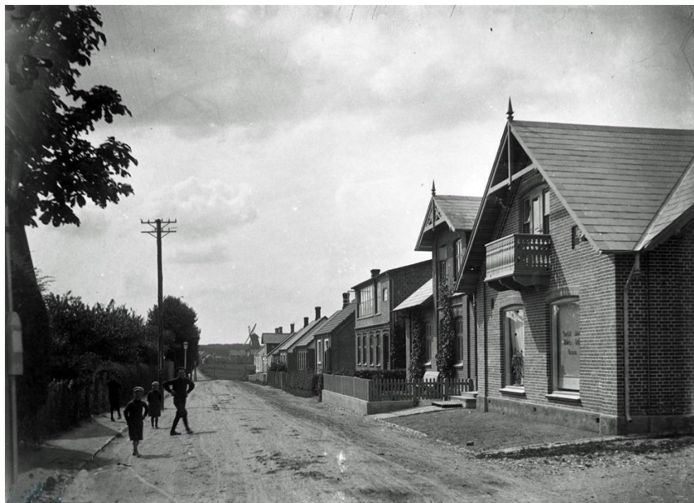
Søndergade ca. 1907