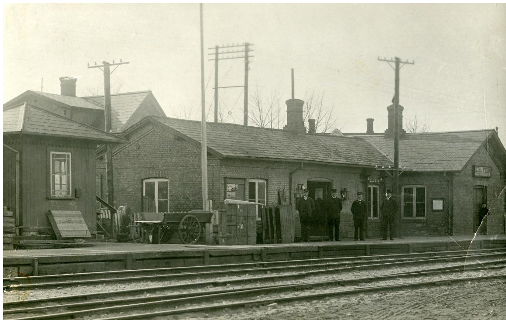
Den gamle station i Gelsted før 1911.

Blev i 1911 til ledvogterhus, da den nye stationsbygning kom i brug. Lå på hjørnet af Jernbanegade og Søndergade.