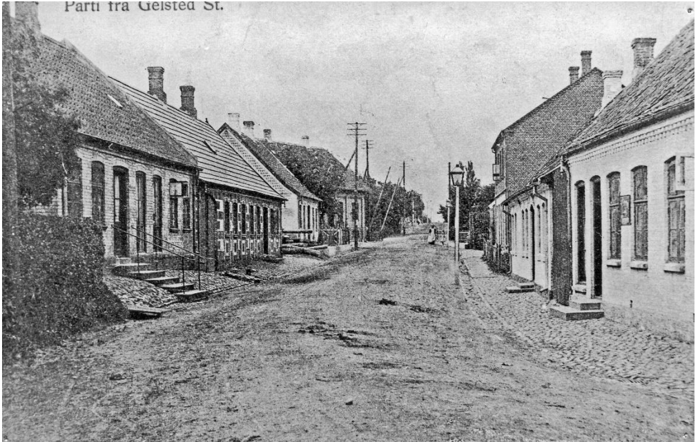
Nørregade før 1909.