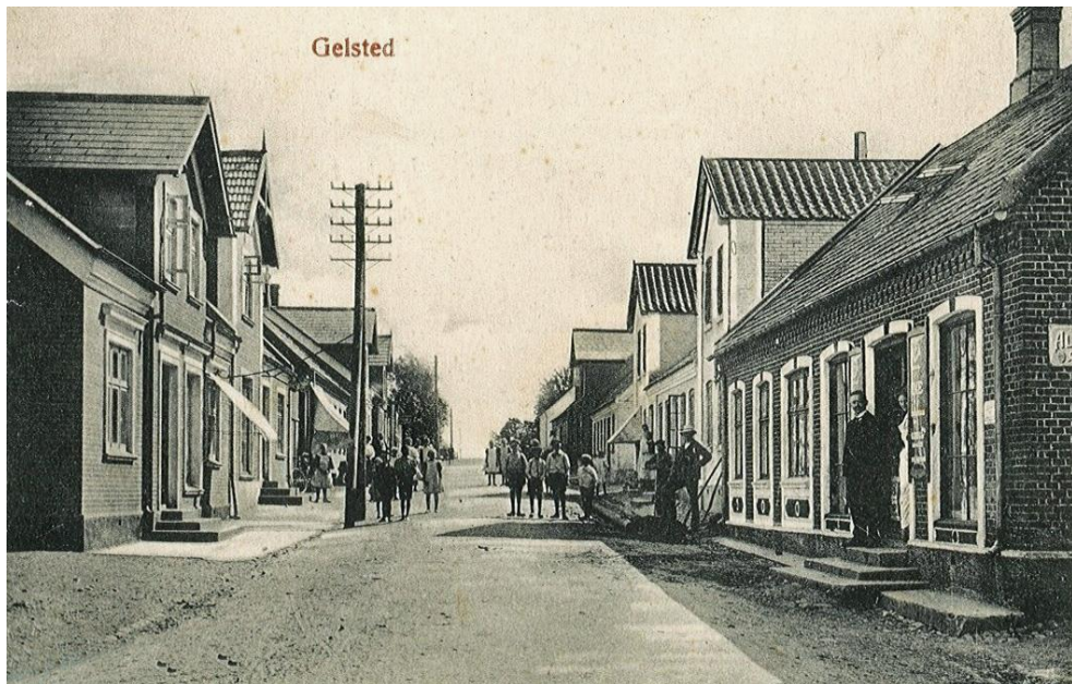
Søndergade før 1918.