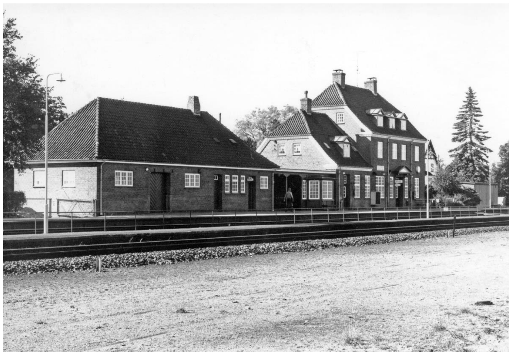
Den nye stationsbygning.