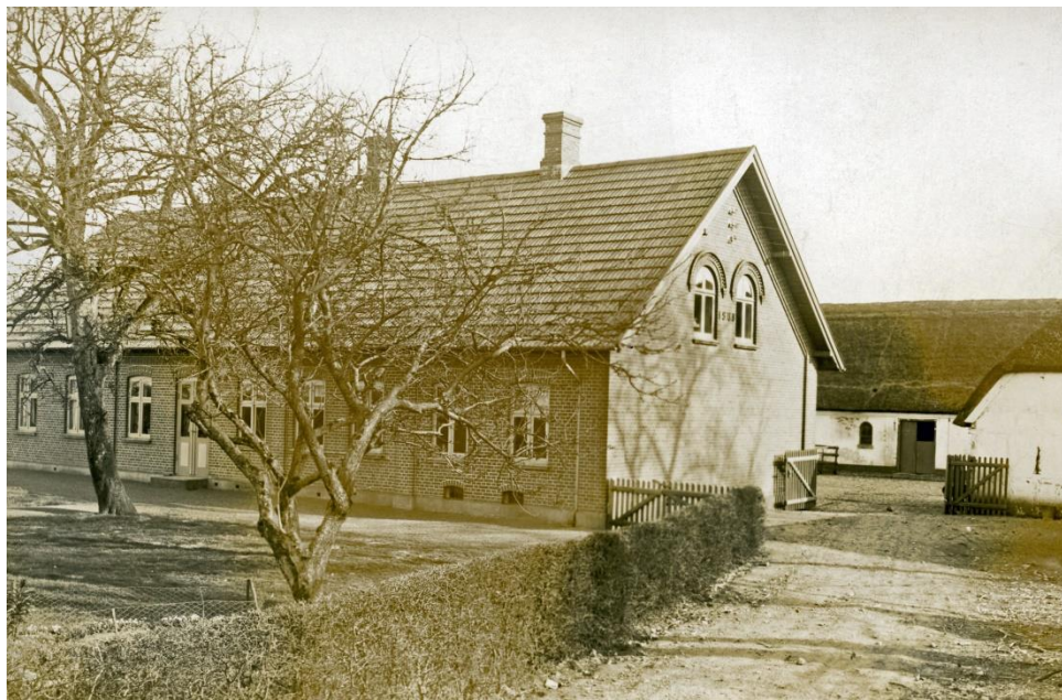
Gelsted Østergård set fra haven.

Der er ingen grund til at tvivle på, at der i Gelsted sogn har boet mennesker "altid". Sognet har ligefrem inviteret til bosætning med sit kuperede terræn, skovområderne og rigeligt med vådområder, et sandt spisekammer for vore forfædre.