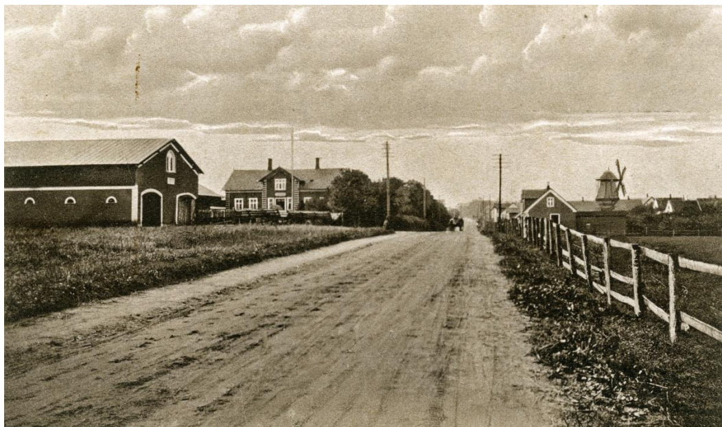
Holmegården og Holme Mølle ca. 1910.