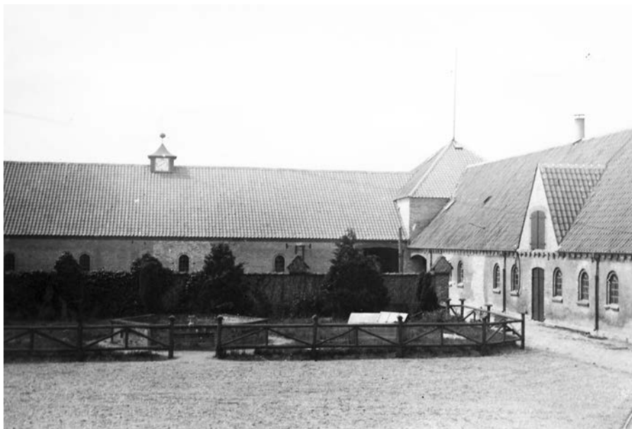
Gårdspladsen på Brogården