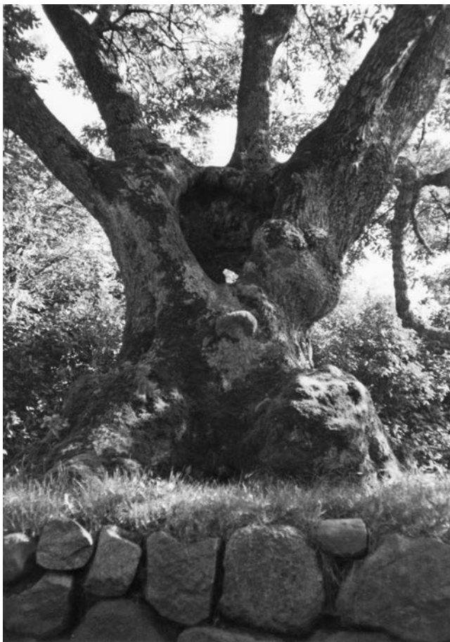
Asketræ ved Bro Bystævne

Vi har valgt at bruge en del af Bro Bys Laugs protokol og to erindringer fra Bro Strandgårds brand og barndom på Brogård, samt en indkommen fortælling fra Bro Skov.