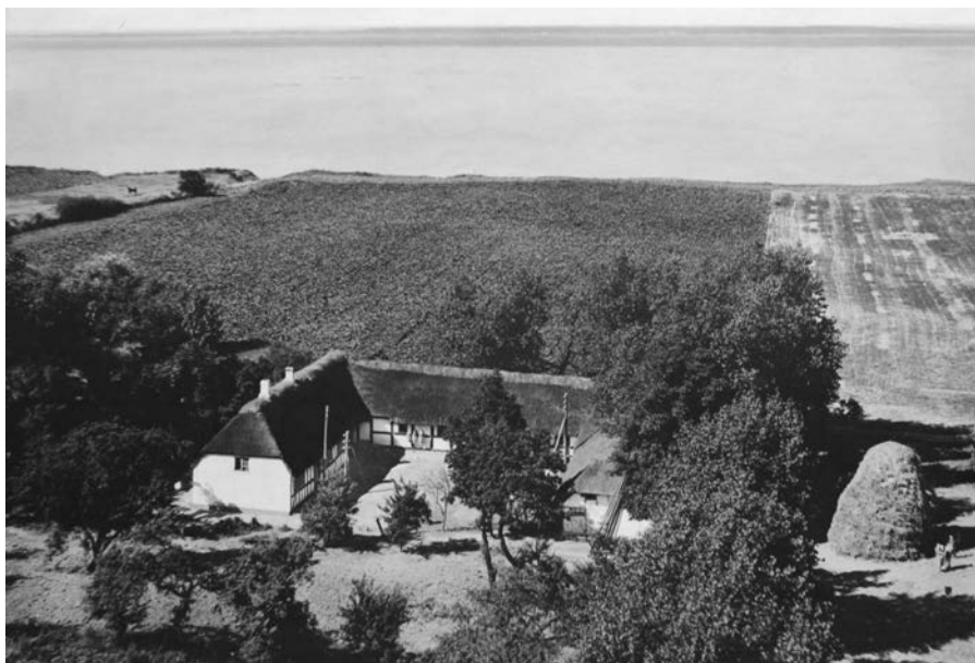
Bro Strandgård før branden