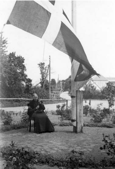
Bro by's ældste kvinde 1942