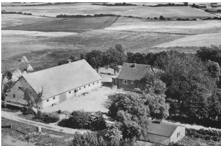
Bro Strandgård efter branden