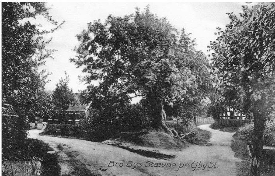
Bro By's stævne ca.1910