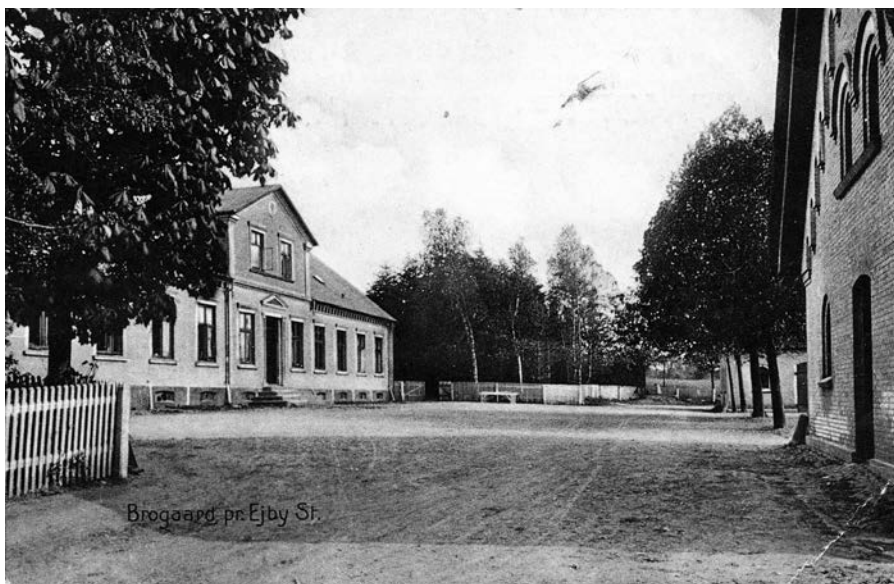
Indkørsel til Brogården, 1908