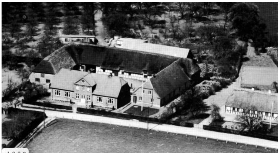
Rosenvoldgården, Brovangen 10