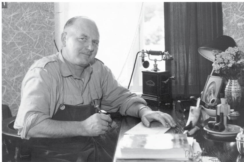
Laurits fatter pennen

Det blev til flere digte fra Finland, og Theodor kunne også sætte dejlige melodier til sine digte. Sigfred var dog den af brødrene, der nåede længst, når det drejer sig om poesi. Hvem kender ikke hans viser ”Nu går våren gennem Nyhavn”, ”Katinka”, ”Jeg plukker fløjlsgræs” og mange flere?