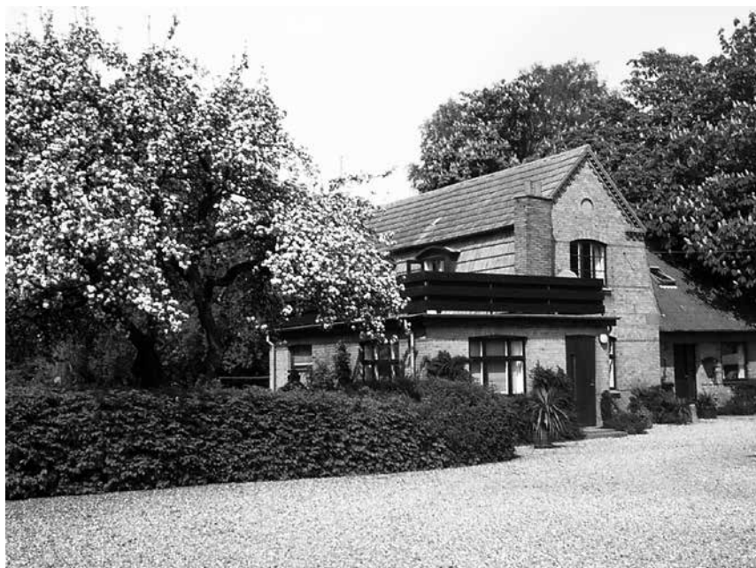
Villaen ved Indslev Bryggeri