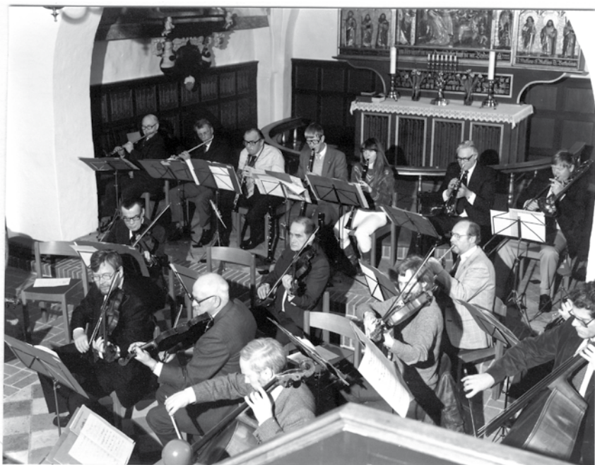
Nordvestfyns Privatorkester ved en kirkekoncert.