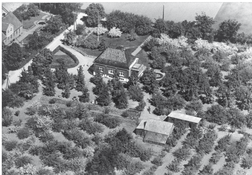
Juelsminde, ca. 1939.

træerne. Det var hans hobby at pøde og lave nye sorter. Men min far fik ret hurtigt det store antal reduceret til ca. 30. I maj måned var det hvert år et utrolig smukt syn, når alle træerne stod i fuldt flor, og så i august startede æblehøsten med de lyse Transparente Blanche og så gik det slag i slag til ind i september med de ildrøde skovfogedæbler og Pigeoner, de gule Filippa'er, Graasten'er, Guldborgæbler og Pederstrup for at slutte i oktober med Signe Tillisch, de aflange Flaskeæbler, Bodil Neergaard, Belle de Boskoop og flere andre. Men også de mange flotte pæretræer i haven var fars stolthed. Den saftige og velsmagende spisepære Colore de Jueliet, de store Clapps Favorite og Fundante, Grev Moltke og den engelske Williams Duchess og flere andre.