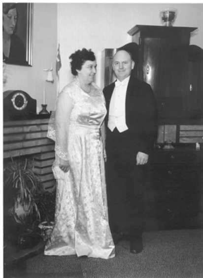
Fars og mors sølvbryllup, 30. 10. 1955