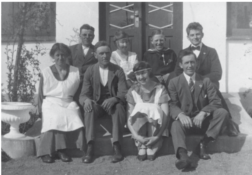
Min far og mor på Brobjerg 1929. Mor foran i midten, far bagerst til højre