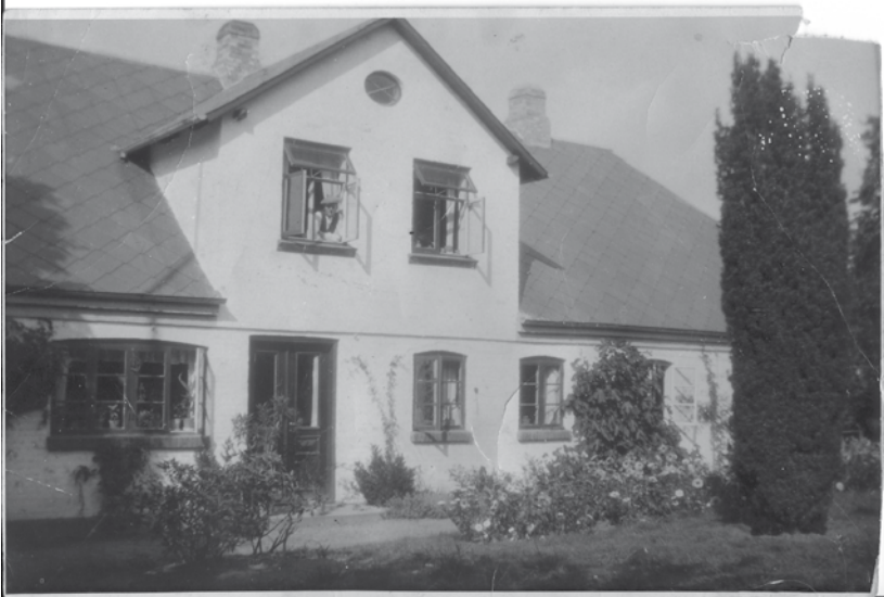
Theodor i vinduet på Dalagergård, ca. 1937

Kom med mig ud i lune lunde, Hvor alt er stille, alt er tyst Når dagens sangfugl atter blunde Og drømmer sødt om dagens dyst.